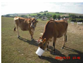
Pollux & Ares

Mit einem weinenden und einem lachenden Auge haben wir uns von allen verabschieden dürfen. Denn junge und gesunde Tiere sollen den Rest ihres Lebens nicht auf unserem Gnadenhof verbringen, sondern noch auf großen Weiden toben dürfen.