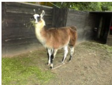
Einen neuen Stall für 4 Lamas