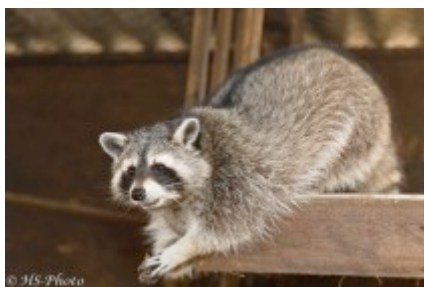
Wir möchten auch ein neues Gehege – bitte, bitte