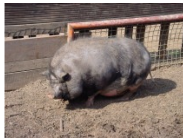
Ein neues Schweine- Haus und eine Gehege- erweiterung