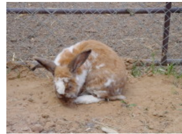
Meeris und Kaninchen ein Innen – und Außen- Gehege